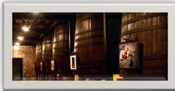
Vin källaren hos Franco-Españolas

Logroño får bli slutstationen för denna såväl visuella som vininspirerade resa. Du bör nu kunna ha bilen full av goda viner. Logroño är en större stad. Vid infarten ligger bodega Franco-Españolas. Hit begavs sig Hemingway ett flertal gånger för att handla vin, så varför inte göra så ni också? köp en flaska och sätt er på floden Ebro's bank och njut av regionen Rioja som du nu har passerat, i alla fall en liten del av den.